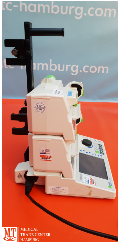
MT MEDICAL TRADE CENTER HAMBURG