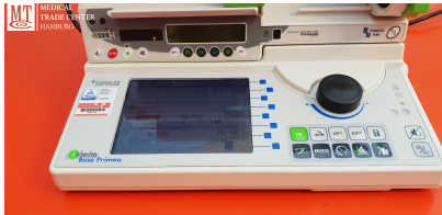
MT MEDICAL TRADE CENTER HAMBURG