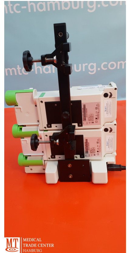
MT MEDICAL TRADE CENTER HAMBURG