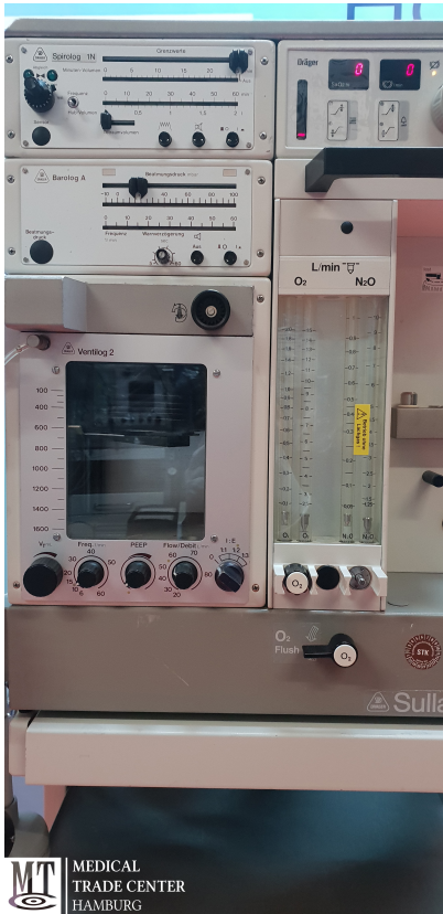
MT MEDICAL TRADE CENTER HAMBURG