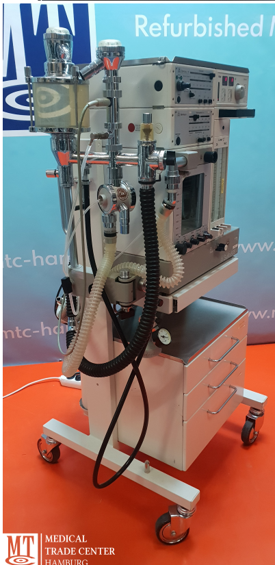
MT MEDICAL TRADE CENTER HAMBURG